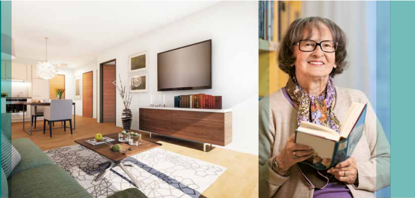
2-Zimmer-Wohnung Typ A (ca. 48 m 2 )